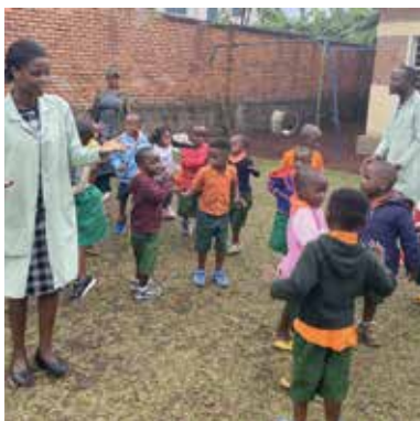
Vélo Sokone p41