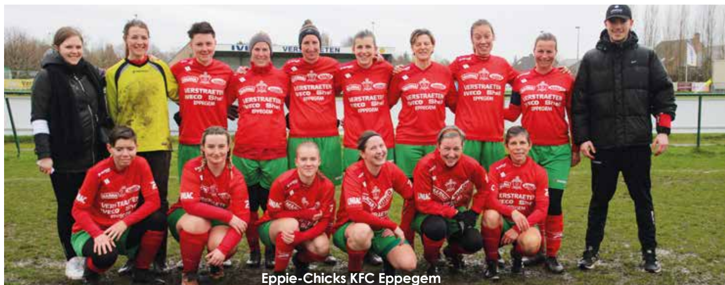
Eppie-Chicks KFC Eppegem