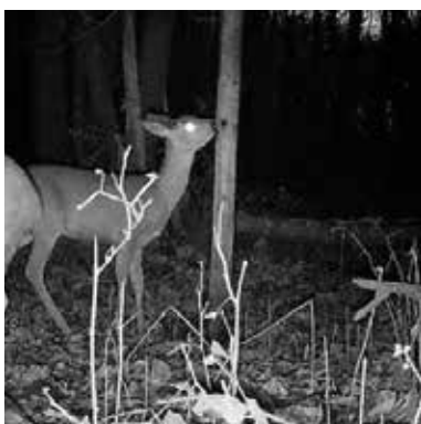
Het jaar rond met de jager p45