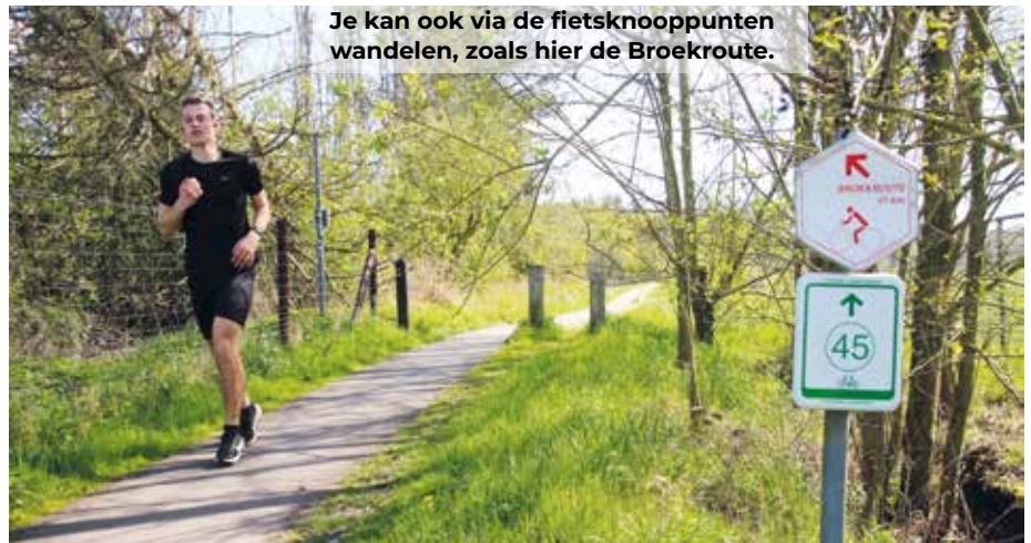
Je kan ook via de fietsknooppunten wandelen, zoals hier de Broekroute.

Maar niet getreurd, want ook voor dit wandelpubliek werkt men nu aan een super alternatief! In deelgemeente Zemst plant men een wandeling geschikt voor mensen met een beperking of met kinderwagens en -fietsjes, steps e.d. Er ligt al een voorontwerp op tafel, perfect geschikt mits kleine aanpassingen aan de huidige ondergrond her en der. Men zal dit traject van wegwijzers voorzien met een keuze voor een korte of iets langere wandeling.