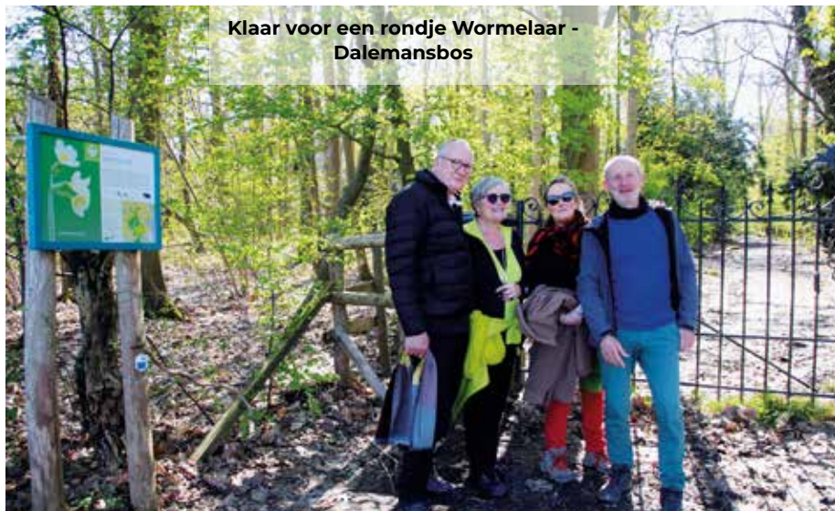
Klaar voor een rondje Wormelaar - Dalemansbos

Op 30 augustus wordt de top drie van wandelgemeenten bekendgemaakt.