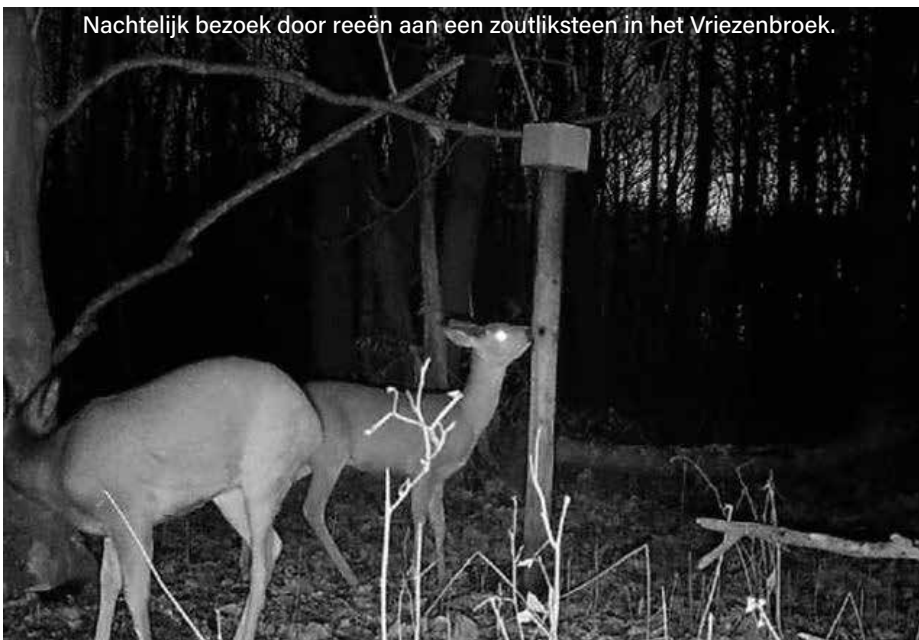
Nachtelijk bezoek door reeën aan een zoutliksteen in het Vriezenbroek.

Tekst: Bart Coopman